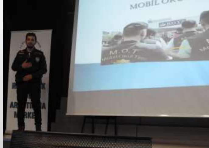
Kadıköy İlçe Emniyet Müdürlüğü Mobil Okul Timi “Okul Bildirimlerinde İzlenen Süreç”